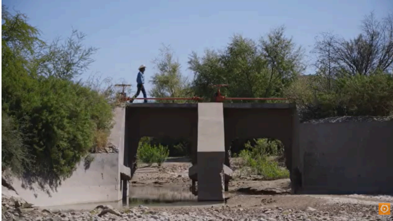
Fotograma del documental "Aigua Tèrbola: el negoci d'Agbar a Mèxic". David Andreu Solà, 2020.

Aquesta peça audiovisual, d'una durada d'entre 15 i 30 minuts, es construirà conjuntament amb les entrevistes, cumós i tallers, introduint, en la mesura del possible, dinàmiques específiques de vídeo comunitari. La peça serà, per tant, una bitàcola del procés, una crònica dels principals valors propis del comunisme a través del relat d'aquest a Sapeira i un exercici de memòria i d'imaginació col·lectiva.