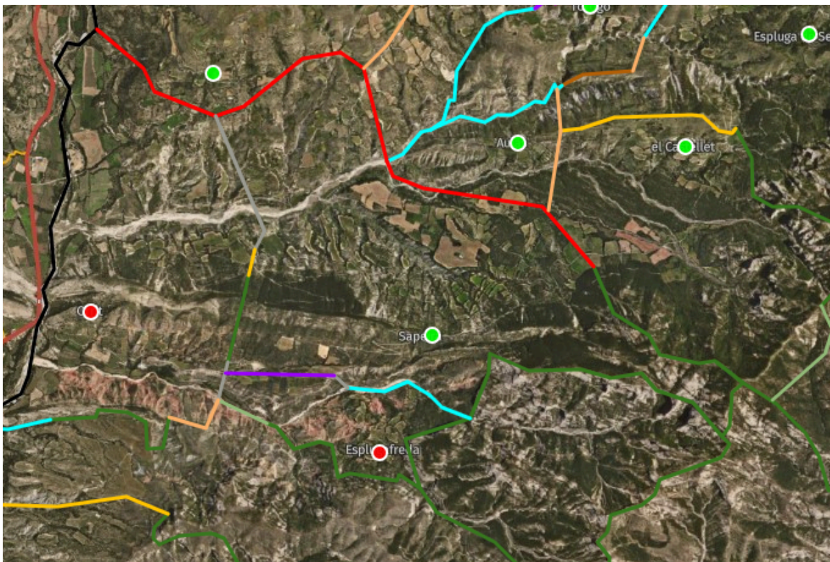
Mapa 1: Termes comunals de l'Alt Pirineu i Aran.

Pel que fa al bosc comunal de Sapeira, històricament es destinava a aprofitaments forestals per a carbó, llenya, fusta i calç. Actualment, és propietat de l'Ajuntament de Trep i està inclòs dins de l'àrea de caça de Trep per voluntat d'un descendent de l'últim alcalde de Sapeira. Així és aquesta societat de propietaris qui s'encarrega d'arrendar-lo juntament amb altres terrenys particulars per l'aprofitament cinegètic. A part de la caça l'aprofitament forestal ha quedat reduït al senderisme i a la recollecció de bolets.